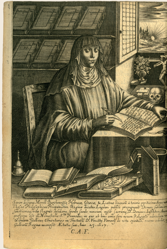
Julienne Morell, Traicte de la vie spirituelle par St Vincent Ferrier, Lió, Jullieron, 1617 (1a ed.). Avignon Bibliothèques (Ville d'Avignon), 8°18827.

El llegat retrobat de Juliana Morell, humanista polifacètica i escriptora espiritual ens convida a submergir-nos en el seu món i a experimentar-lo amb els cinc sentits. Poeta, música, filòsofa i teòloga, Morell encarna la lluita històrica de les dones per accedir a una formació acadèmica, alhora que es pot considerar un reflex viu i intens de la cerca individual i col·lectiva d'un espai propi on poder sentir i pensar per ella mateixa. El seu pensament articula la lògica i la mística eròtica d'una manera orgànica i fluïda, tenint com a resultat la dissolució d'una paradoxa. Per a Juliana Morell, raó i amor van de bracet: l'una pondera les decisions i l'altre connecta les persones entre si i amb la divinitat.