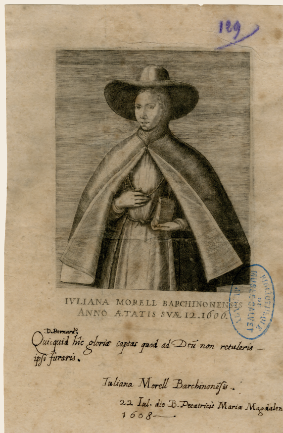
Retrat de Juliana Morell (1606). Avignon Bibliothèques (Ville d'Avignon) - Établissement public communal - Fondation Calvet, Est. Atl. 15/129.