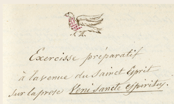
Avignon Bibliothèques (Ville d'Avignon) - Établissement public communal - Fondation Calvet, ms. 1991, f. 16.