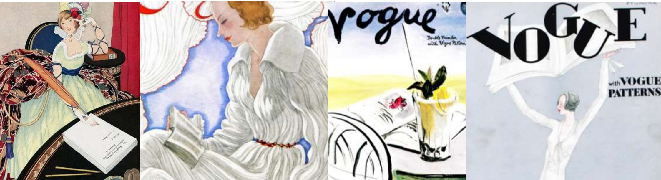
Disseny de Georgina Rabassó. Imatges: portades de la revista Vogue .