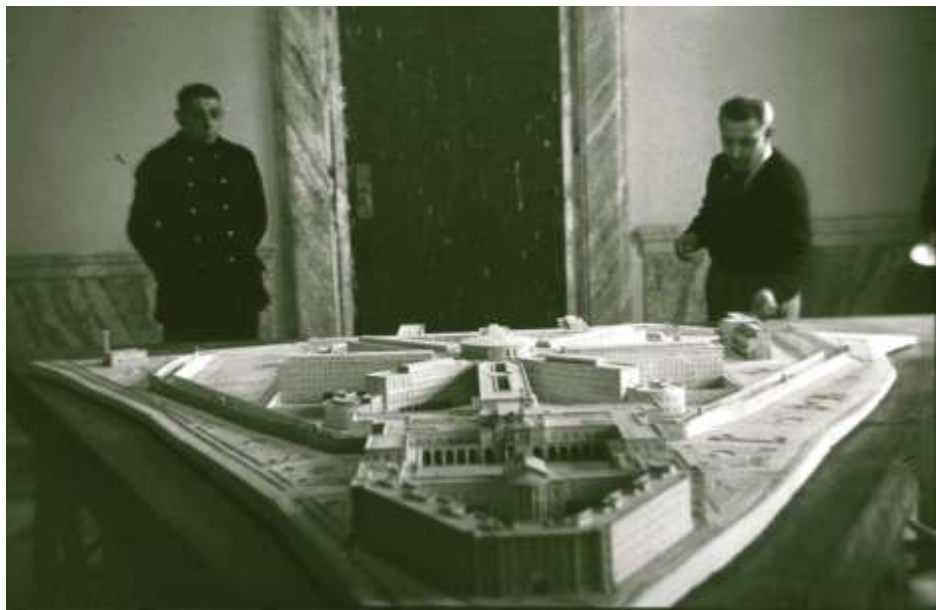
Figura 1. Maqueta de la nueva Cárcel Modelo de Madrid. 1 de febrero de 1941

Finalizada la guerra, se planteó al Nuevo Estado un problema penitenciario sin precedentes, derivado del mantenimiento en distintos ámbitos de detención de enormes masas de población. La cuestión carcelaria era especialmente grave en Madrid, cuya cárcel modelo, situada en Moncloa (en el solar donde se proyectó y construyó después el Ministerio del Aire), había quedado completamente arrasada por el frente. La necesidad de descongestionar las numerosas e improvisadas cárceles que habían sido habilitadas durante la guerra y la inmediata posguerra para dar cabida a la enorme marea de prisioneros republicanos 16 , convirtió en prioritaria la construcción de una nueva cárcel. La Prisión Provincial de Hombres de Madrid, ubicada en el distrito madrileño de Carabanchel, fue mandada construir por Franco en 1939 para sustituir a la antigua Prisión Modelo de Madrid. Además de cumplir su función fundamental como centro de internamiento, debería servir como escaparate propagandístico de la política penitenciaria de la dictadura 17 .