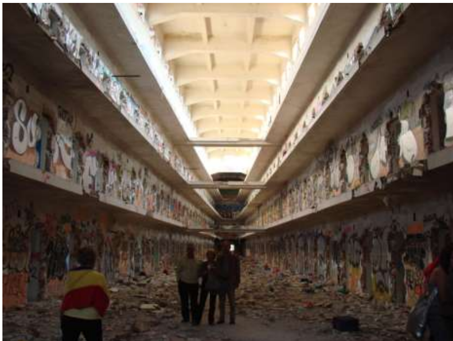
Figura.5. Militantes políticos fotografiándose en las galerías esquilgadas de Carabanchel 27 de septiembre de 2008

La reutilización de los edificios carcelarios, una vez que son desafectados de sus funciones iniciales, cubre un amplio abanico que comienza por su conservación como sitios históricos que pueden ser visitados. Este es el caso bien conocido de la Eastern State Penitentiary, diseñada por John Haviland como la primera gran prisión creada para el correccionalismo basado en el confinamiento individual, que funcionó entre 1829 y 1971 y que hoy en día es uno de los principales atractivos turísticos de Filadelfia. Otros lugares de internamiento, como la prisión de Karosta en Letonia, han encontrado un tipo distinto de público. Esta antigua prisión militar, utilizada por los nazis, los soviéticos y el gobierno letón hasta 1997 es hoy un “hotel temático” que ofrece a los visitantes la posibilidad de experimentar por sí mismos los métodos de vigilancia, malos tratos y pésimas condiciones de vida que sufrieron entre sus muros los auténticos prisioneros.