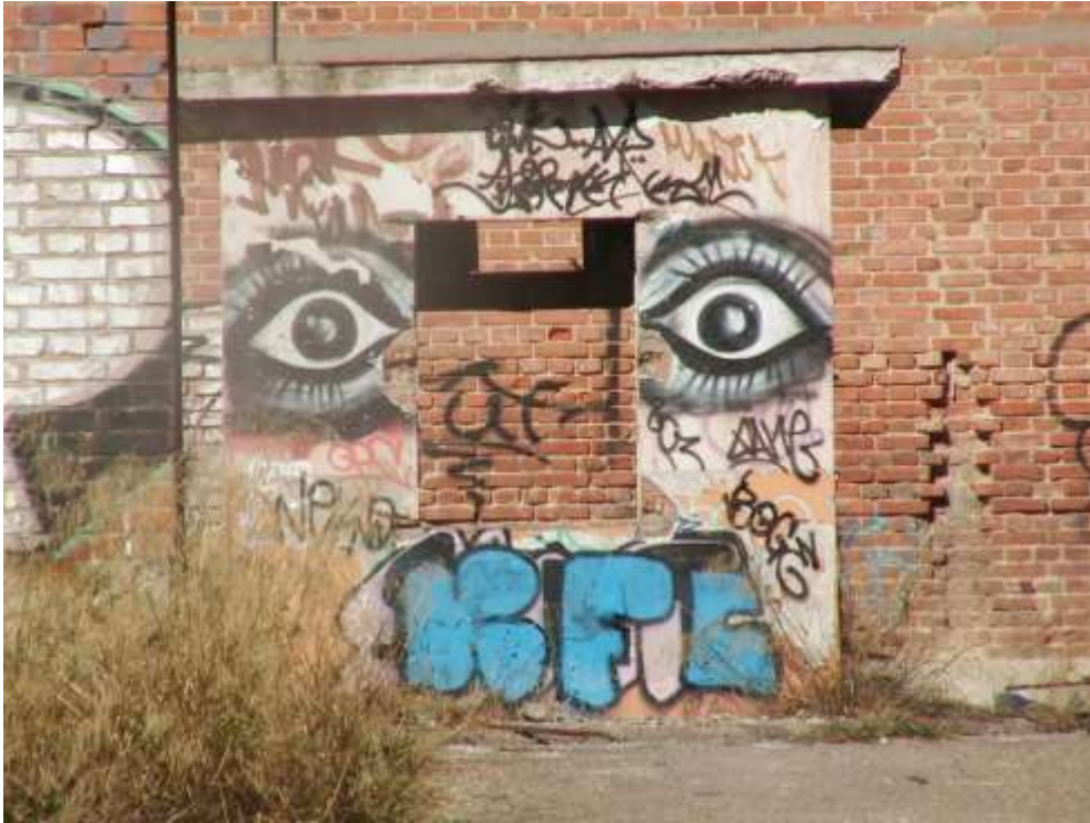
Figura 3. Graffiti en una de las garitas de vigilancia exterior. Cárcel de Carabanchel. 6 de noviembre de 2007.

espera de juicio, prácticamente todos los resistentes y activistas antifranquistas procedentes de cualquier punto de España; además de otros condenados por homosexualidad, “vagancia”, masonería, propaganda subversiva, injurias al jefe del estado o a su esposa, consumo de estupefacientes, hurtos, etc. Así pues, Carabanchel pasó a constituir una metáfora de la represión franquista y como tal identificada por todos los sectores de la resistencia y oposición a la dictadura.