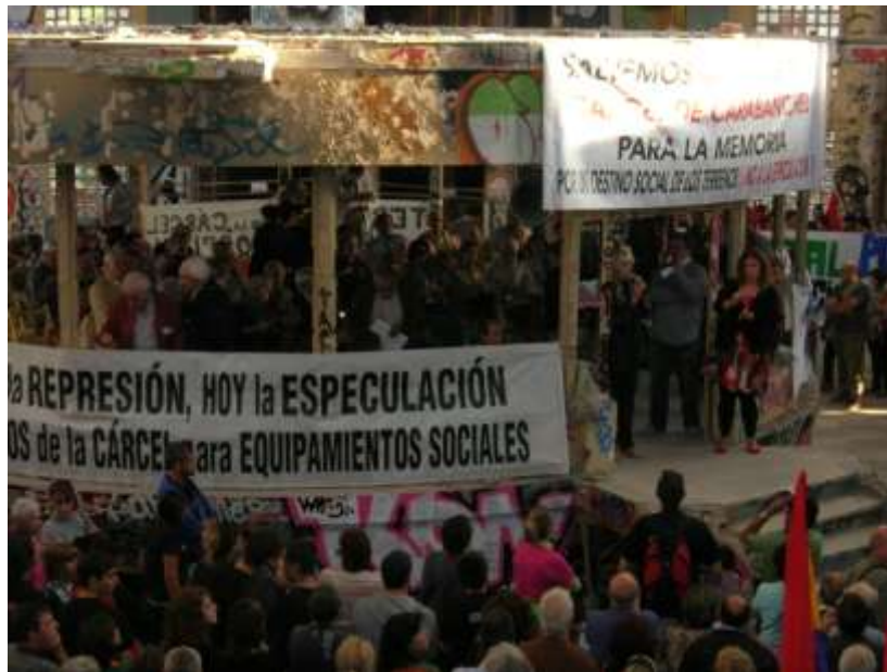
Figura 6. Acto de homenaje a los expresos políticos en el interior de la cárcel de Carabanchel. 27 de septiembre de 2008.

Pero si el carácter patrimonial de muchos edificios y recintos carcelarios está claro, por cuanto remiten a funciones y hechos concretos del pasado 24 , también pueden contarse numerosos ejemplos de antiguas prisiones que alojan hoy museos y centros de cultura de varios tipos; es decir, que han sido resignificadas y resemantizadas como meros continentes para un uso distinto en el presente. Un caso reciente es la inauguración en julio de 2011, en Montevideo, del Espacio de Arte Contemporáneo en una de las galerías de la antigua cárcel que estuvo habitada hasta la década de 1980. En nuestro propio país hay ejemplos relevantes de cárceles históricas recicladas como centros de equipamiento público de tipo cultural: el Archivo Histórico Provincial de Ávila y el Museo Extremeño e Iberoamericano de Arte Contemporáneo de Badajoz, instalados en las antiguas prisiones provinciales; el Centro de Arte “Domus Artium” de Salamanca, que acogen las rehabilitadas galerías de la cárcel o el Museo de Arte Contemporáneo de Vigo (MARCO), instalado en el restaurado panóptico de la antigua cárcel, declarada Bien de Interés Cultural 25 .