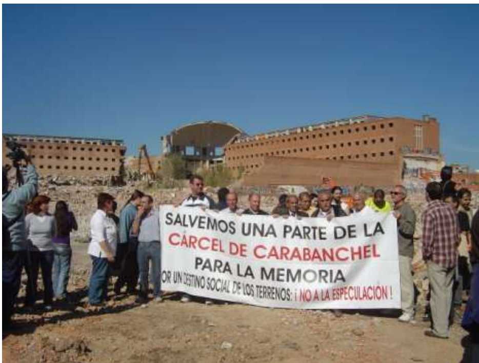
Figura. 8. Manifestantes en los terrenos de la cárcel durante el derribo. 26 de octubre de 2008.