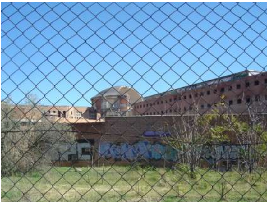
Figura 7. Cúpula central de Carabanchel, semiderruida. 26 de octubre de 2008.

posibilidad de redimir o devolver al presente, en forma de bondades o bienes sociales, un pasado de daño; una especie de segunda oportunidad para unos sitios que nacieron con objetivos muy distintos. Con todo, las posibilidades de su conversión en lugares con un significado distinto al que tuvieron y para el que fueron creados no dejan de ser limitadas. Así, en los sitios relacionados con hechos ignominiosos, fundamentalmente los campos de exterminio nazis, no deberían considerarse las posibilidades de resignificación organizada del espacio, ante la fuerza de evocación del pasado que contienen de por sí. En el caso concreto de los sitios ligados a la represión desempeñada por regímenes políticos dictatoriales su importancia como “lugares de memoria” parece clara. Sin embargo, no deja de haber elementos controvertidos o de consenso difícil en torno a cómo se produce (y re-produce) su memoria, los contenidos que se quieren establecer en cuanto a sus significados y, en suma, las posibilidades de su gestión política democrática. A pesar de todo, no se discute la necesidad general de enraizar, de dar cobertura material a la rememoración, en lo que se ha llamado “trabajos de memoria” 26 y la importancia que tienen en este sentido los lugares de “conciencia”: unir a los ciudadanos en torno a unos lugares de memoria en los que puedan identificarse y a partir de los cuales puedan surgir narraciones y performances consensuadas sobre el pasado común (Fig. 6).