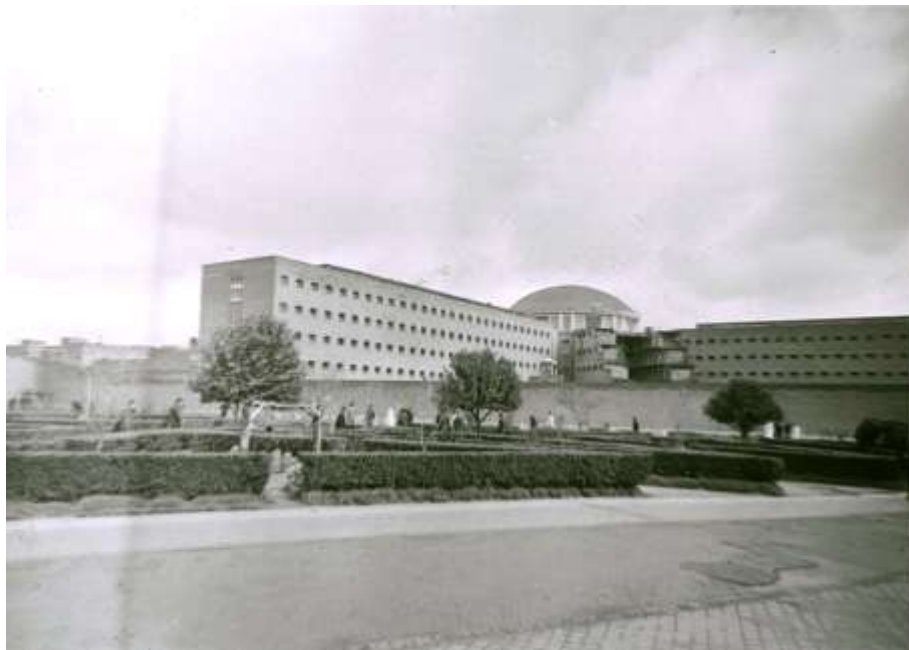
Figura 2. Edificio central del Complejo Penitenciario de Carabanchel, con una de sus galerías inconclusas 9 de marzo de 1962

Con la enorme mole de la prisión provincial instalada en el sur de Madrid, en un área muy cercana a la metrópoli y que se configuraba ya en los años de la postguerra como un lugar de asentamientos suburbanos para las grandes masas de población que acudían a la capital procedentes de la inmigración interior, el régimen de Franco no solo pretendía resolver un problema penitenciario acuciante 18 . También, y fundamentalmente, con la erección del moderno complejo perseguía construir una imagen de poder omnipresente (la cárcel podía ser divisada fácilmente desde muchos puntos de los dos Carabancheles y Aluche), y una autorepresentación como productor de un sistema de correccionalidad moderna y justa (a la vez que cristiana), que el discurso oficial contraponía al caos y la inseguridad jurídica que intentaba hacer consustancial al régimen republicano, a través de la prolongación casi eterna de los horrores cometidos por éste durante la guerra, y que le servía también para hacer frente a las denuncias internacionales sobre sus formas de represión política 19 .