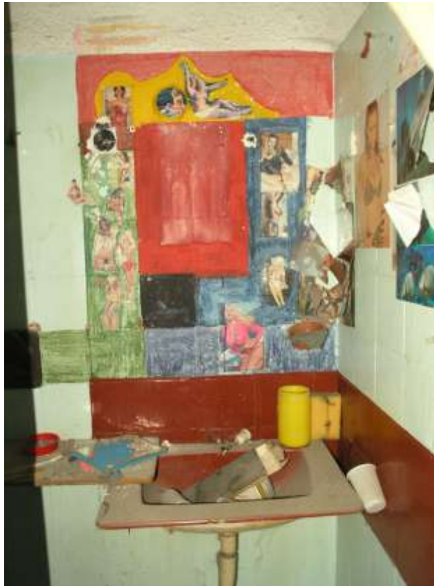
Figura.4. Lavabo de una de las celdas. Cárcel de Carabanchel. 8 de marzo de 2007.

trabajadores clandestinos fueron extrayendo sus innumerables rejas y cerramientos metálicos (figs. 3 y 4).