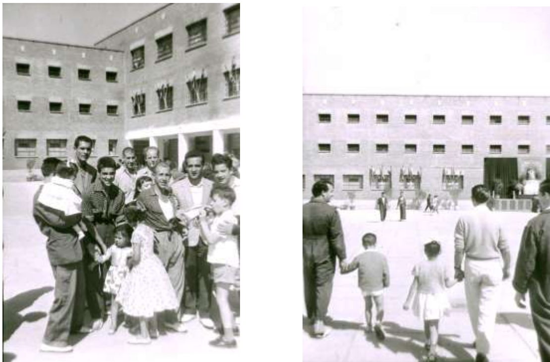
Figura10. Reclusos de la Prisión Provincial de Madrid con sus hijos el día de la Merced. 24 de septiembre de 1960.

Nos hemos ocupado de la memoria del lugar y la historia de la cárcel como resultado de una serie de acciones políticas y disputas sociales sobre su significado. Ahora, mediante el análisis del discurso de varios expresos políticos, veremos cómo ese lugar y esa historia se inscriben en la subjetividad de los actores sociales que participaron en la construcción significativa de la cárcel, en este caso a través de una serie de prácticas de resistencia al franquismo. Queremos señalar la dinámica de un doble proceso social: por un lado, los actores construyen los lugares, se disputan su significado social y su proyección política; por otro, los lugares y su significación socialmente elaborada se interiorizan en la subjetividad de los actores, en una proyección identitaria que se remite al lugar como marco de referencia.