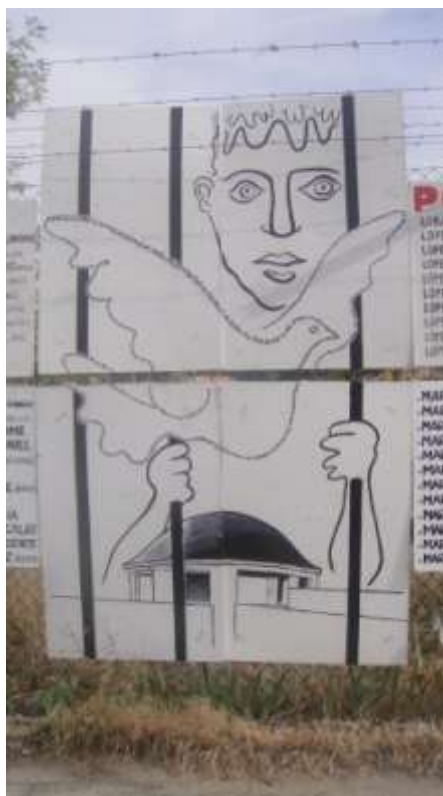
Figura. 9. Instalación conmemorativa en el perímetro de la cárcel derruida. Primer aniversario del derribo, 25 de octubre de 2010.

La desaparición del edificio convirtió una construcción que durante diez años fue una ruina, evocadora de su existencia como lugar de represión, en un ámbito vacío donde algunos grupos todavía hoy se empeñan en convocar, como si de un espectro se tratara, el espíritu de los que allí sufrieron prisión por motivo de su ideología, su orientación sexual o su lucha sindical; en suma por la defensa de las libertades (figs. 8 y 9). Los distintos intereses urbanísticos y de los partidos políticos impidieron que la gente pudiera apropiarse del lugar, borrando todo rastro de la cárcel, pero dejando, sin embargo, vivas algunas de sus antiguas funciones carcelarias, ya que el sitio sigue albergando un centro de detección; eso sí, adaptado a las formas y necesidades de una nueva forma del biopoder: El Centro de Internamiento de Extranjeros (CIE) de Aluche, que sigue aun hoy instalado en las apenas remozadas instalaciones del antiguo hospital penitenciario de Carabanchel 30 .