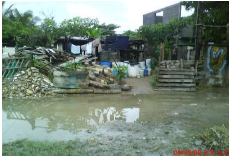
Imagen 6. Colonia Candelario Garza