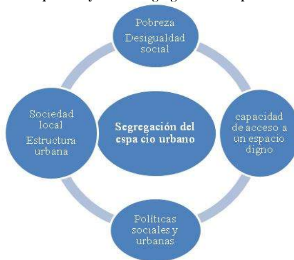
Figura 1. Factores que influyen en la segregación del espacio urbano

Desde los orígenes de la ciudad, la diferenciación socio-espacial ha sido una de las características de la estructura urbana. En América Latina se dan estructuras de segregación socio-espacial; entendiéndose el término de segregación como el proceso de la concentración selectiva de grupos sociales o demográficos en partes de la ciudad. Dicha segregación puede ocurrir como proceso voluntario o forzado e influyen diversos factores para que ésta se dé. Véase figura 1.