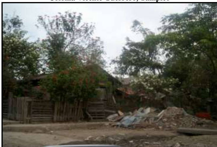
Figura 4. Colonia Vicente Guerrero, Tampico

En el cuadro se resumen los aspectos más relevantes en cuanto al proceso de formación y desarrollo del asentamiento. Dicho proceso en cada asentamiento es dinámico y empezó a excepción de uno por invasión u ocupación ilegal, en su primera etapa, después renta o venta; el otro asentamiento fue reubicación, aunque entra en el rango de ocupación semi-ilegal.