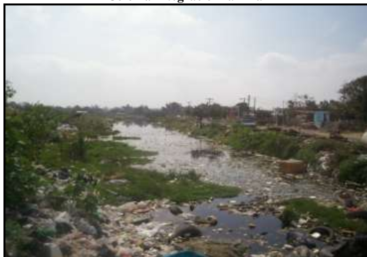
Imagen 7. Colonia Integración familiar

En el caso de la colonia Integración Familiar, se tomo como una ocupación semi-ilegal ya que aunque fue una reubicación de familias que invadieron y rellenaron algunas áreas de la Laguna La Ilusión en ciudad Madero, los habitantes aceptaron, y el Instituto Tamaulipeco de vivienda y urbanismo apoyo en la regularización de los predios; y actualmente ya es una colonia formal, los terrenos no eran adecuados para asentar familias, ya que son zonas inundables, además de estar cercana al ex basurero municipal, el cual todavía funciona de manera clandestina y no ha sido saneado por las autoridades municipales.