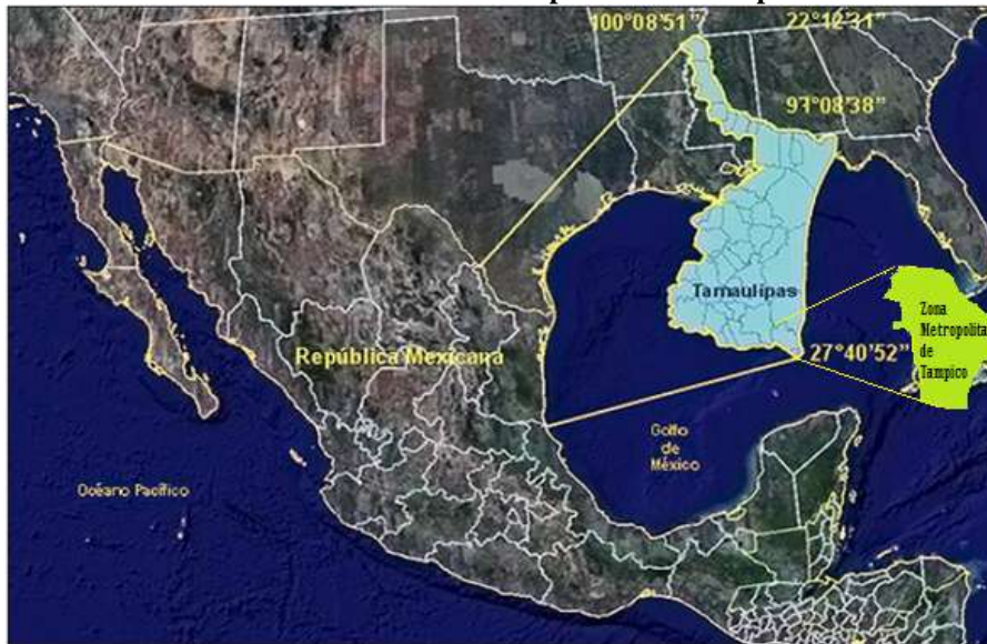
Figura 2. Ubicación de la Zona Metropolitana de Tampico