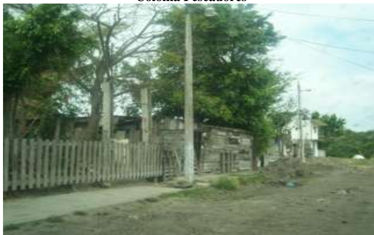
Figura 5. Colonia Pescadores

El siguiente paso es la instalación de la vivienda y posesión del predio, para lo cual hubo gestión de servicios básicos en un inicio irregulares, o tomas generales, esto a través de un líder social, o líder del asentamiento que fue apoyado por la estructura del poder local, ya sea a través de líderes sindicales o de los mismos partidos políticos, así como una instancia gubernamental, el Instituto Tamaulipeco de Vivienda y Urbanismo, para la regularización. Una vez finalizado este proceso inicia al mismo tiempo la urbanización del asentamiento y el mejoramiento de las viviendas. Es un proceso continuo, largo y que depende en mucho de la gestión y apoyo que tengan los habitantes del asentamiento, es decir ha sido variable ya que el poder local ha intervenido y manejado sus intereses, al igual que los habitantes del asentamiento que ceden con gusto para lograr beneficio para su colonia, hasta llegar finalmente a la integración en la estructura urbana como un barrio formal.