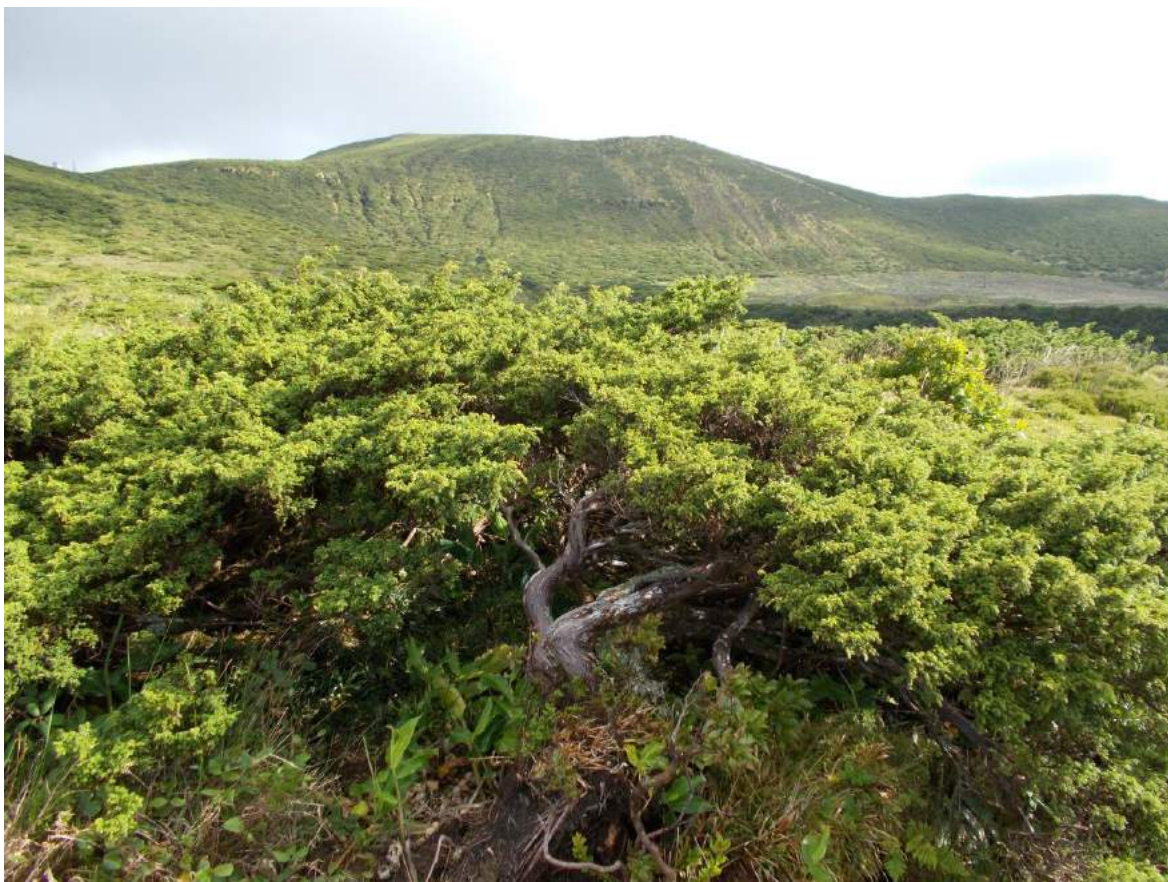
Figura 2. Floresta de laurifolia mixta (arriba) y bosque bajo de Juniperus brevifolia (Cupressaceae) (abajo) en la isla de Flores.