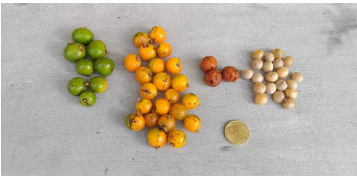
Figura 4. Aspecto de los frutos de un drago ( Dracaena draco ) plantado en Lajes das Flores (isla de Flores). Octubre de 2019.