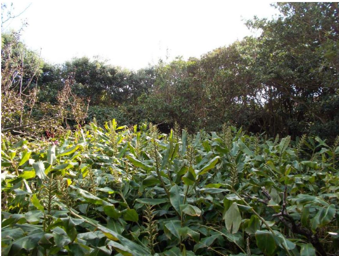
Figura 5. Concentración de cana-roca ( Hedychium gardnerianum ) en los bordes de un cráter de la isla de Flores (arriba) y en un claro de bosque en la isla do Pico (abajo) (Fotos: Juan Carlos Guix).