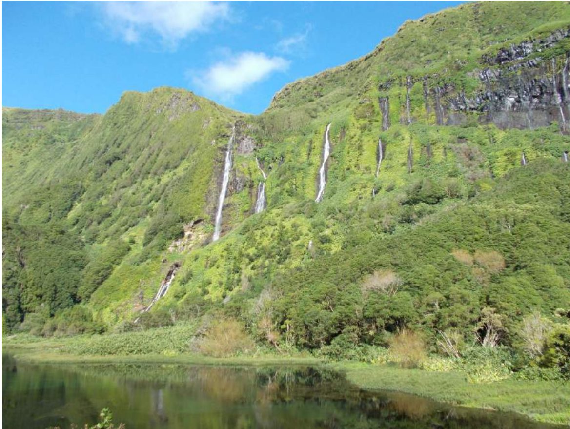
Figura 1. La ausencia de inviernos muy fríos y la abundancia de lluvias finas son algunas de las características climáticas de las islas de las Azores que han propiciado la formación de una vegetación densa y exuberante. En las fotos se contemplan dos paisajes de la isla de Flores.

Sin embargo, debido precisamente a estas diferencias climáticas, las formaciones vegetales pueden ser muy variadas: desde formaciones arbustivas bajas junto a la costa, hasta laurisilvas en las vertientes montañosas y bosques azorianos lluviosos templados, entre 600 y 900 m de altitud, dominados por el cedro-do-mato o zimbro ( Juniperus brevifolia ; Cupressaceae) (Schäfer, 2005).