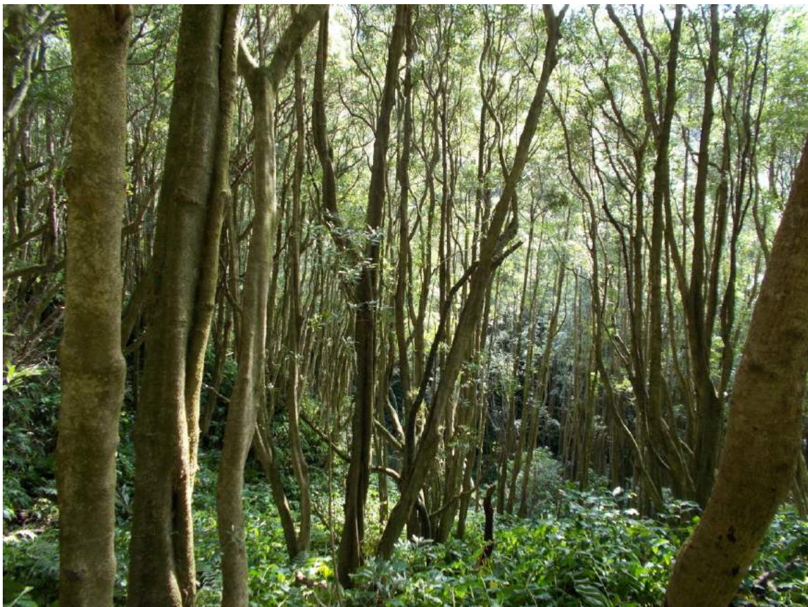
Figura 6. Aspecto de los bosques de incenso ( Pittosporum undulatum ) en las laderas montañosas de la Ilha do Pico.