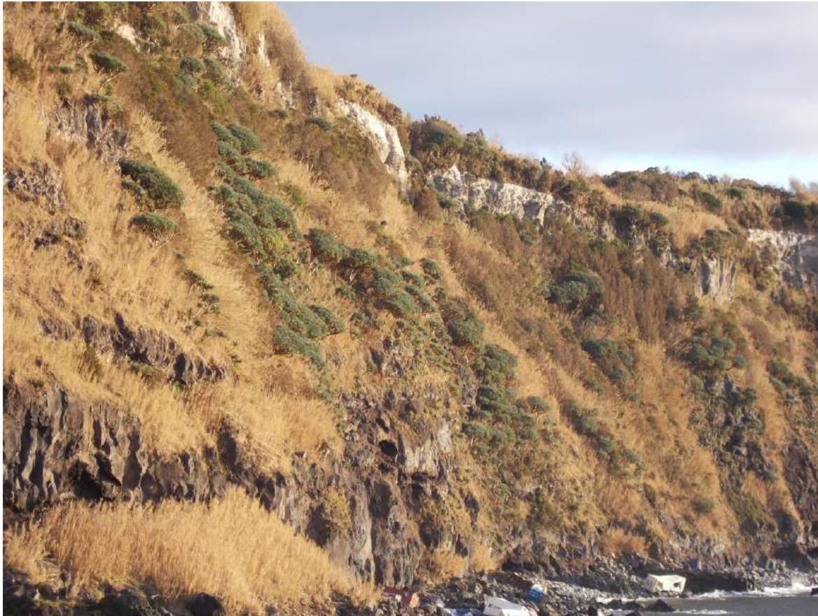
Figura 3. Aspecto de los barrancos del Miradouro das Pedras Brancas (Lajes das Flores) donde se estudió la población de dragos ( Dracaena draco ) en octubre de 2019.

Los suelos de estos barrancos son pedregosos, con presencia de diversos afloramientos de rocas de dimensiones muy variadas. Los dragos crecen en estos cortados, en áreas de suelos muy erosionados y bien drenados, ya sea en pequeñas terrazas, en drenajes e incluso grietas y fisuras en las rocas. En estos ambientes se han encontrado especímenes adultos fructificando, de entre 1,65 a 4,30 m de altura.