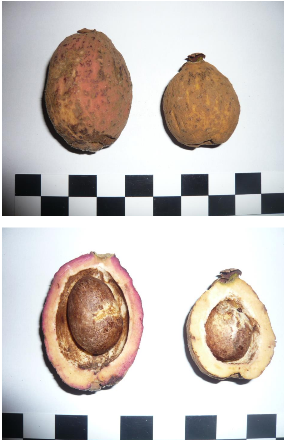
Figura 2. Frutos de Eugenia mosenii (Myrtaceae) de la zona de Castelhanos, en la isla de São Sebastião, sudeste de Brasil. Cada recuadro en la escala equivale a 20 mm.

en el río de Castelhanos (junto a la playa de Castelhanos). Considerando que es frecuente también encontrar árboles de esta especie de mirtácea creciendo junto a los márgenes de ríos y riachuelos, es posible que sus semillas puedan ser dispersadas también a través de la hidrocoria.