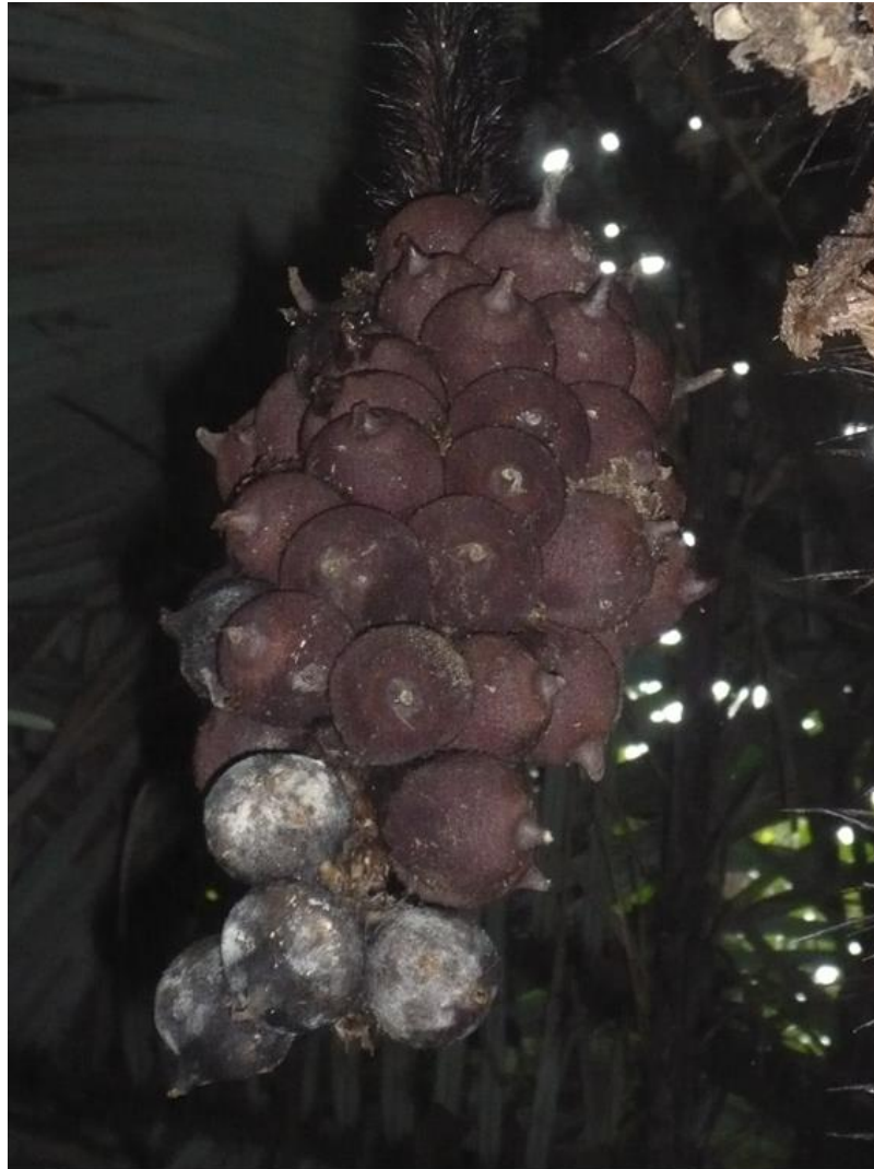
Figura 1. Frutos de Syagrus pseudococos (arriba) y Astrocaryum aculeatissimum (abajo) (Arecaceae). Cada recuadro en la escala equivale a 20 mm