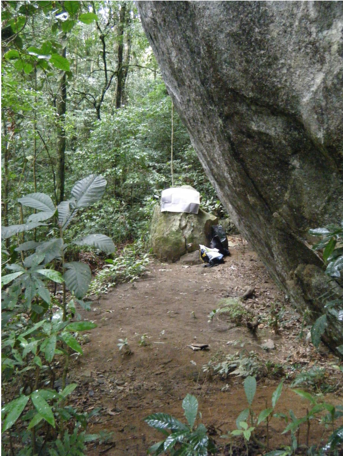
Figura 5. Abrigo de piedra con restos de industria lítica y fragmentos de cerámica indígena antigua de diferentes cronologías. Trilha da Toca da Goteira, bosque lluvioso costero (altitud: 600 m), isla de São Sebastião.