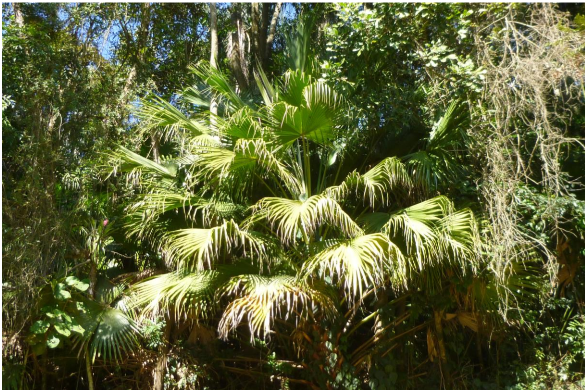
Figura 3. Ejemplar adulto de Livistona chinensis (Arecaceae) creciendo en el margen de un bosque del sudeste de Brasil (Foto: Juan Carlos Guix).

En la isla de Búzios, diversas especies de plantas foráneas productoras de frutos carnosos fueron halladas en los huertos de pescadores caiçaras a comienzos de la década de 1990, entre otras Terminalia catappa (Combretaceae), Coffea arabica (Rubiaceae) y Syzygium cumini (Myrtaceae) (Begossi et al., 1993).